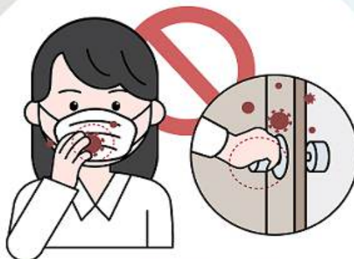
③ 마스크 겉면을 만지는 행위