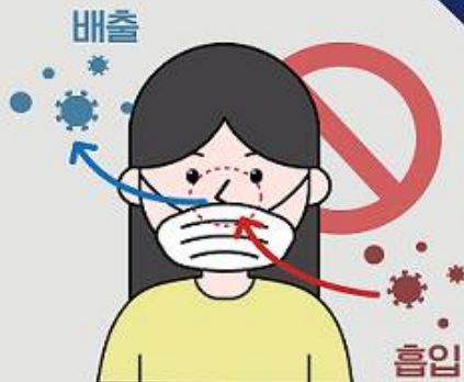
① 코가 노출되는 마스크 착용