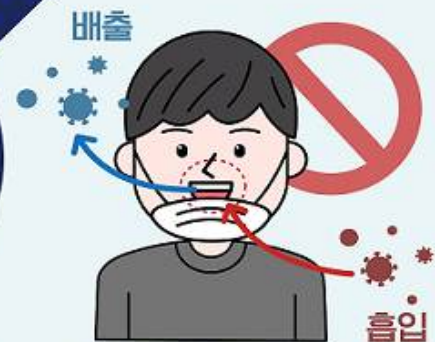
② 턱에 걸치는 마스크 착용